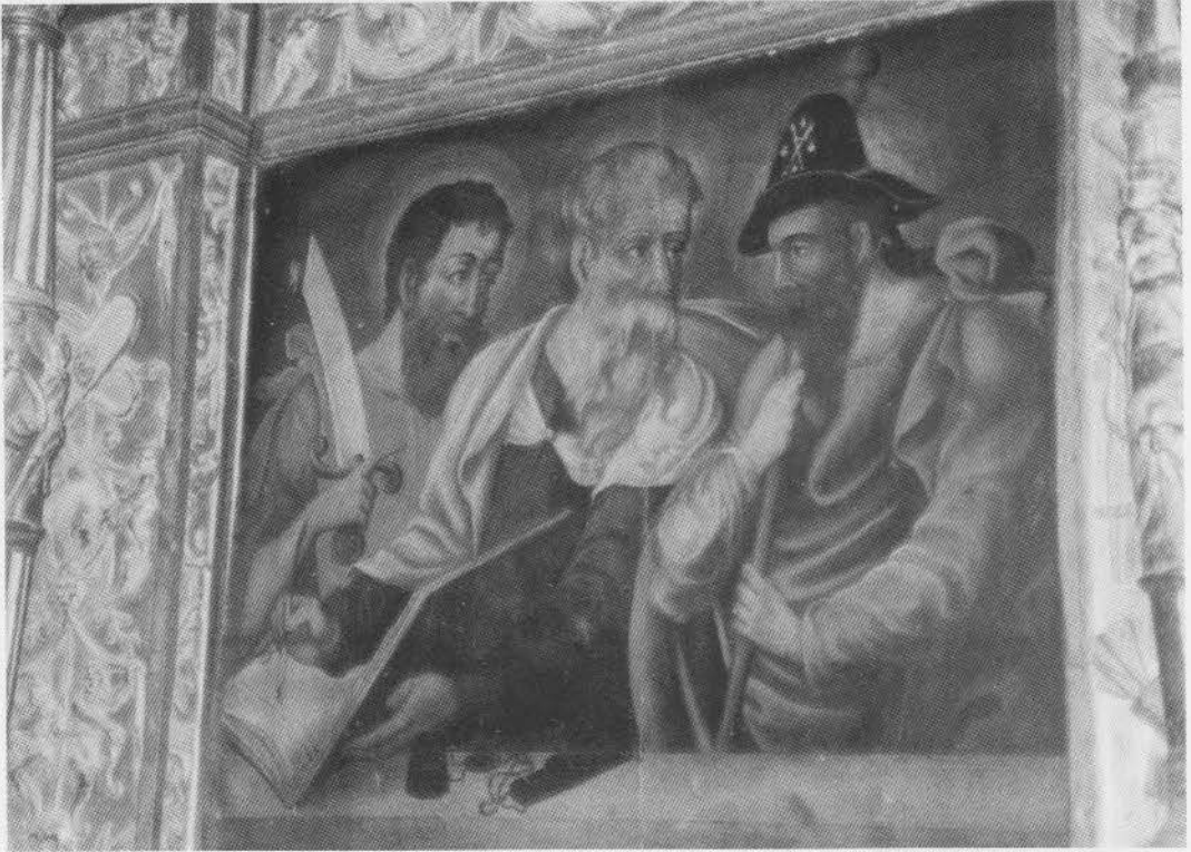
8. LAGUNAS DE SOMOZA. Retablo Mayor. Predela. Pablo, Mateo y Santiago el Mayor. Siglo XVI.