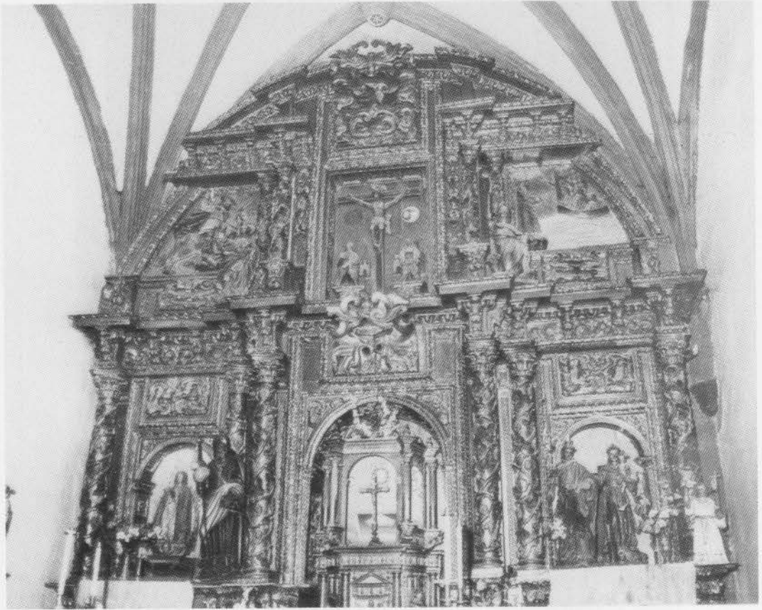
5. EL GANSO. Retablo Mayor. Siglo XVII.