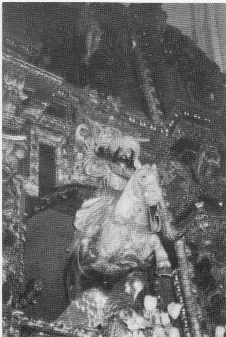
13. SANTIAGOMILLAS. Retablo Mayor. Santiago matamoros. Siglo XVII.