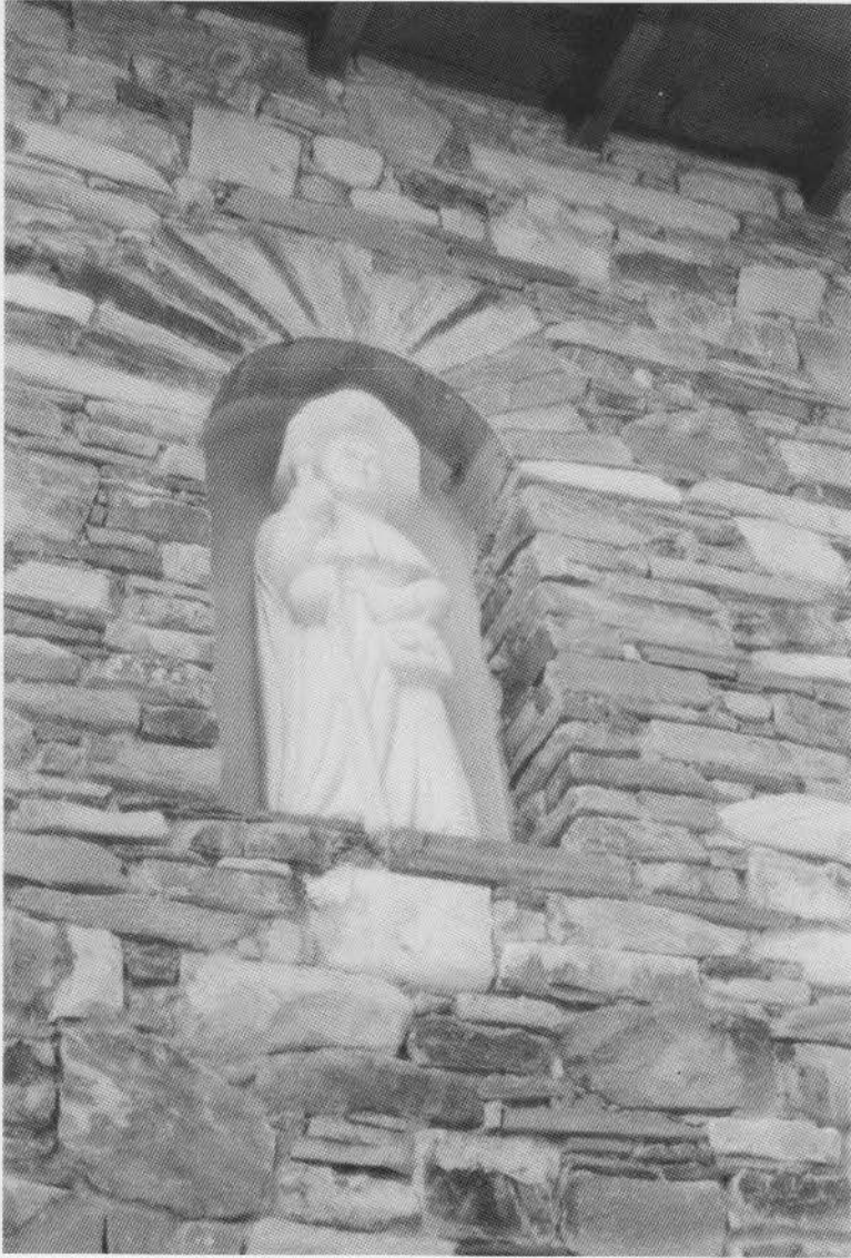
12. RABANAL DEL CAMINO. Refugio de peregrinos. Santiago Peregrino. 1993.