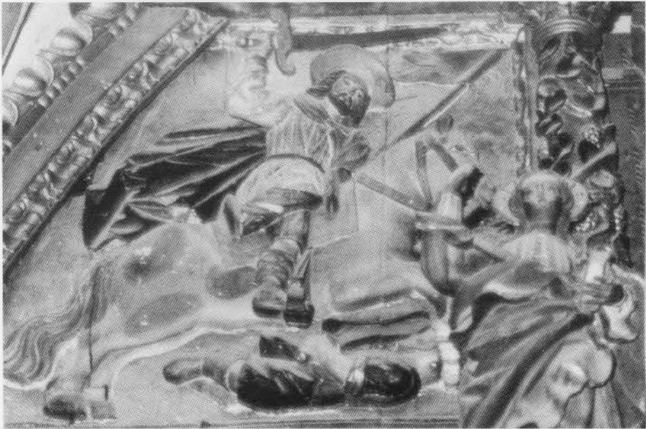
6 y 7. EL GANSO. Retablo Mayor. Vocación de Santiago y Santiago Matamoros. Siglo XVII.