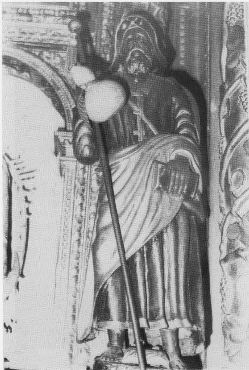
3. EL GANSO. Santiago Peregrino. Siglo XVI.