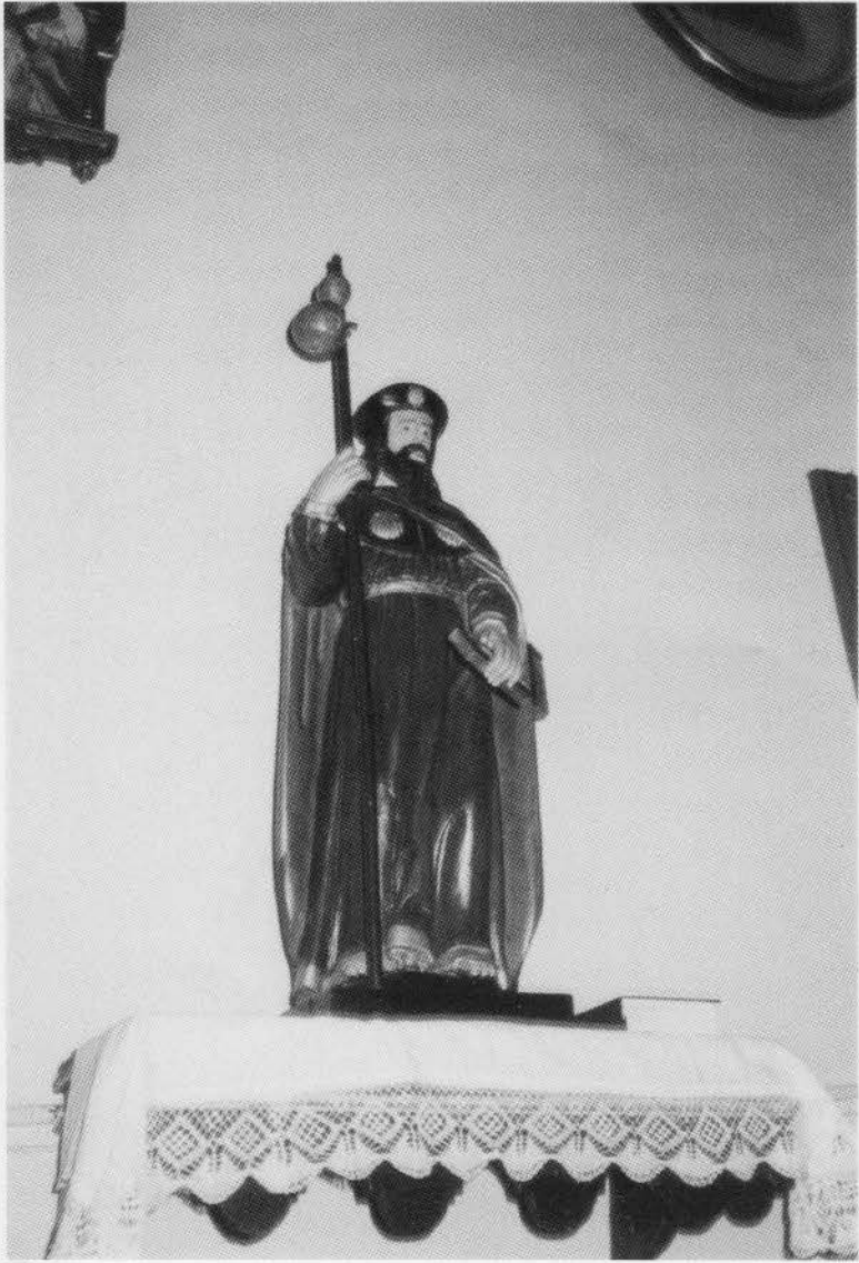
14. SANTIAGOMILLAS. Iglesia. Santiago Peregrino. Siglo XIX.