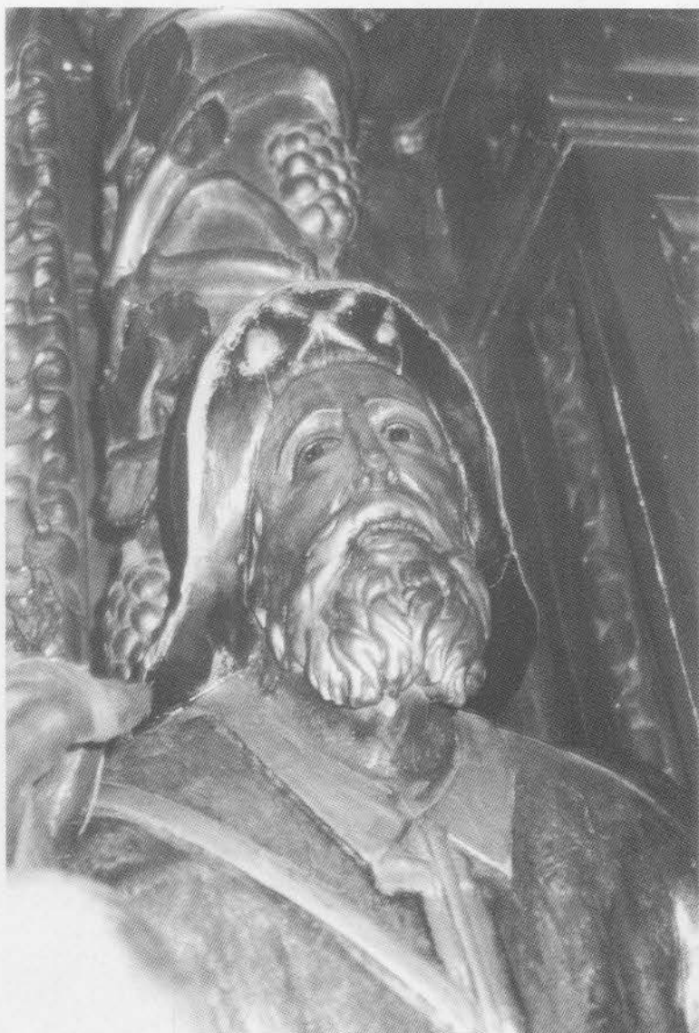
4. EL GANSO. Santiago Peregrino. Detalle.