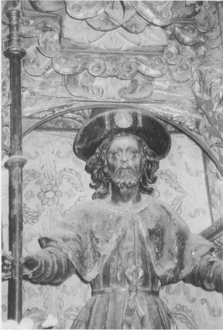
2. CHANA. Santiago Peregrino. Detalle.