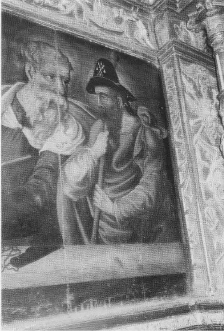
9. LAGUNAS DE SOMOZA. Retablo Mayor. Predela. Santiago el Mayor. Siglo XVI.