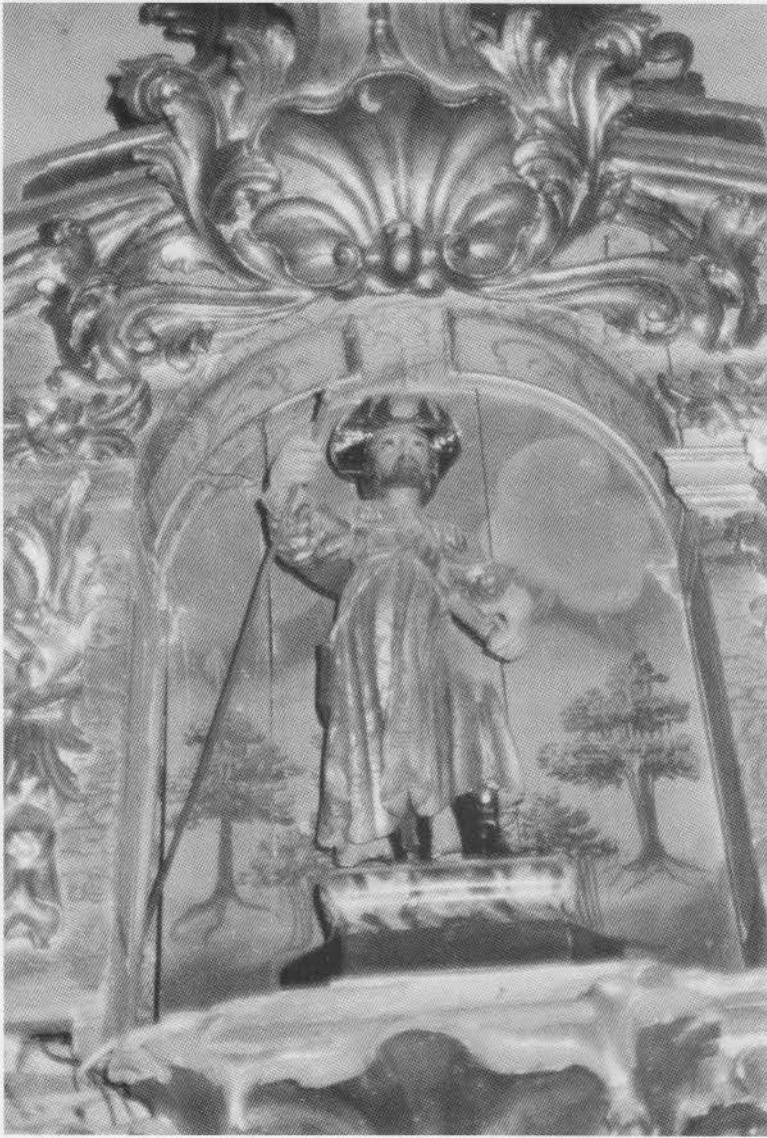
10. RABANAL DEL CAMINO. Iglesia Parroquial. Santiago Peregrino. Siglo XVIII.