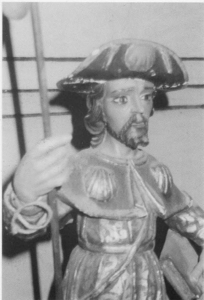
II. RABANAL DEL CAMINO. Iglesia Parroquial. Santiago Peregrino. Siglo XVIII. Detalle.