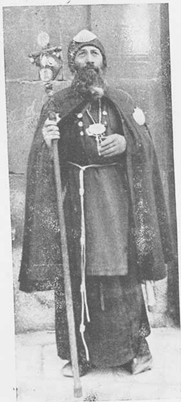
Peregrino actual, con indumentaria arcaizante