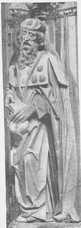
Santiago Peregrino (Cartuja de Miraflores, siglo XV)