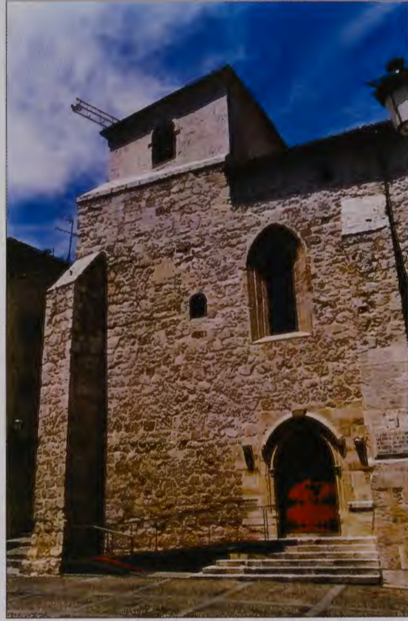
Exterior de la Iglesia de Santiago y Santa Águeda.