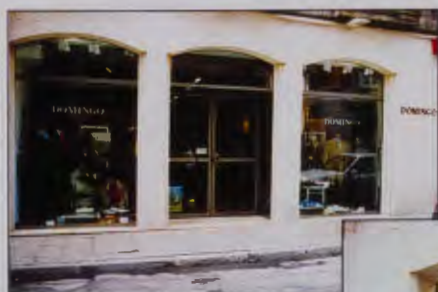
Moneda, 5 Telf.: 947 20 32 92