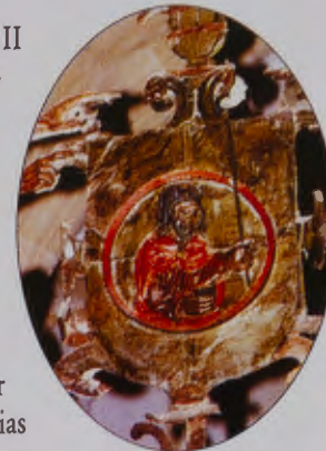
SANTIAGO PEREGRINO Iglesia de Santa María. BEFORADO