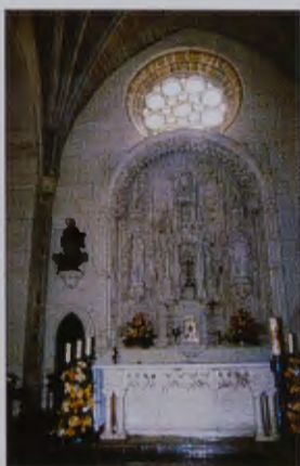
Retablo Santa Águeda