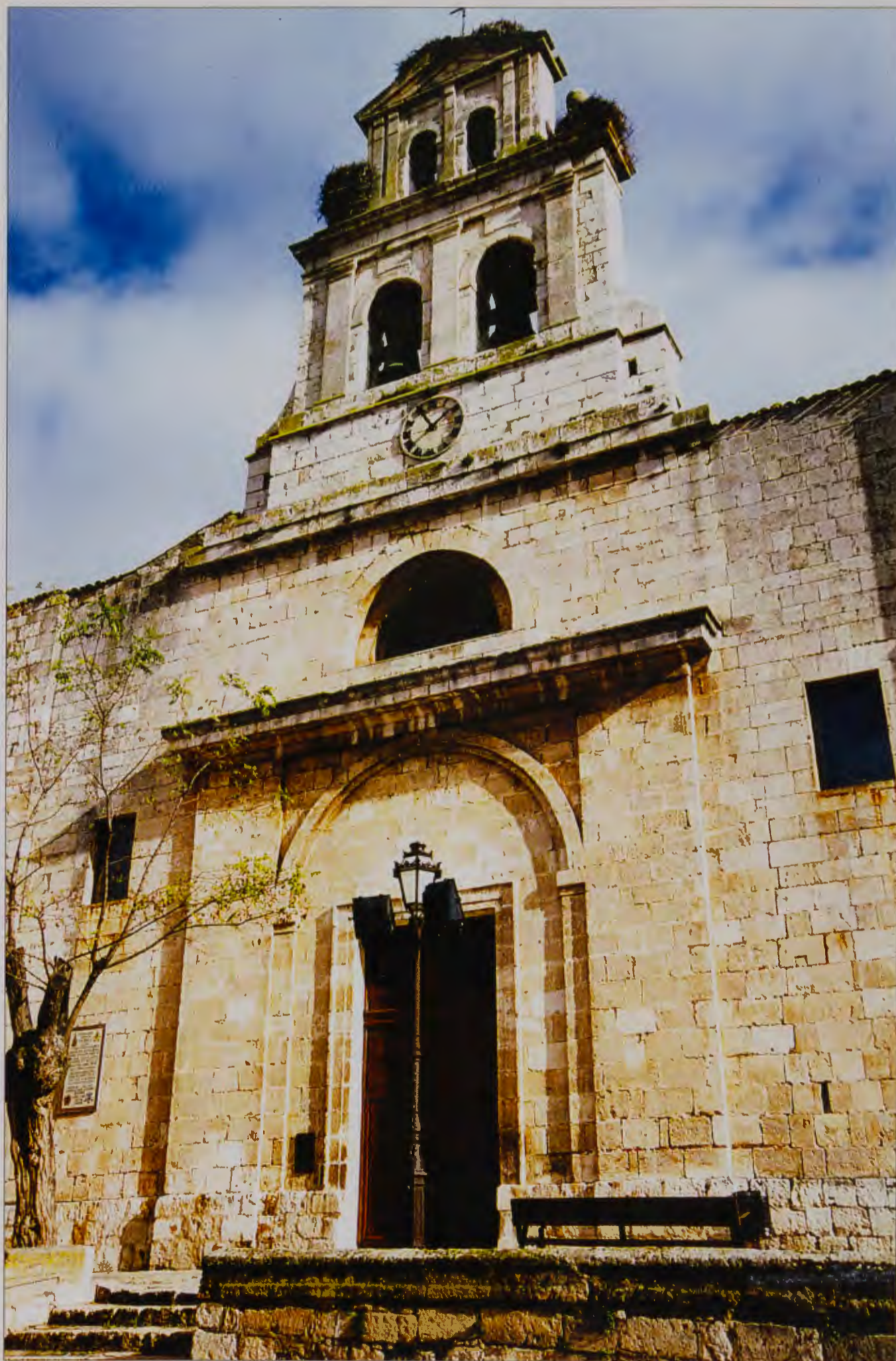
IGLESIA DE SAN PEDRO DE LA FUENTE, en pleno Camino de Santiago. BURGOS.