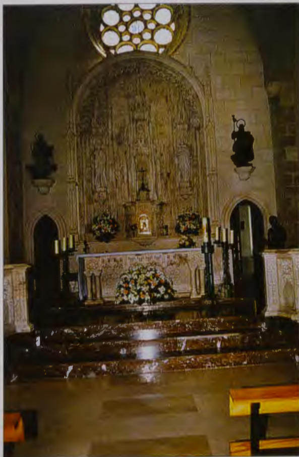
Retablo mayor de la Iglesia de Santiago y Santa Águeda