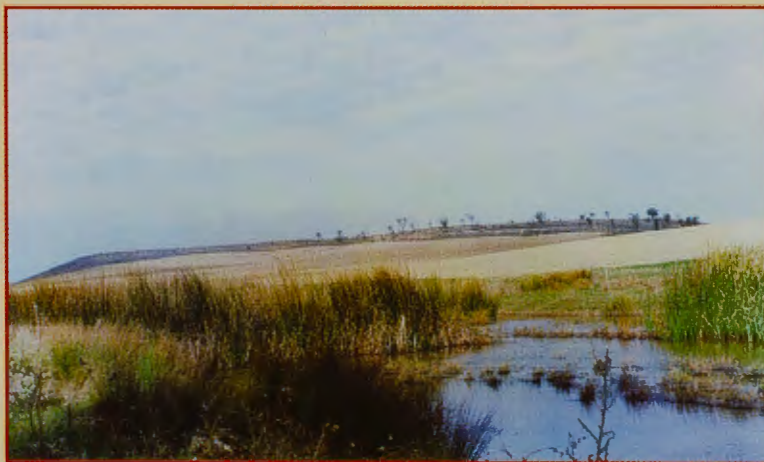
CAÑADA REAL LEONESA OCCIDENTAL. ABREVEDERO BERRUECES.

La arboleda se abre, y es que el caminante ha llegado a la finca Brazuela, espléndida propiedad que mira al río y al pinar. También se abren sus ojos cuando se encuentra con un crucero cobijado bajo un inmenso pino, en una explanada junto al camino. Talladas están en la basa la vieira, la sportilla, el arca con las reliquias, y el bordón. En el capitel se ha tallado el sacrificio del Apóstol, la traslación, el sepulcro y la reina Lupa con los toros. Por las noches un faro, oculto entre la yerba, ilumina el conjunto. El alma del caminante es invadida pronto por un cú-