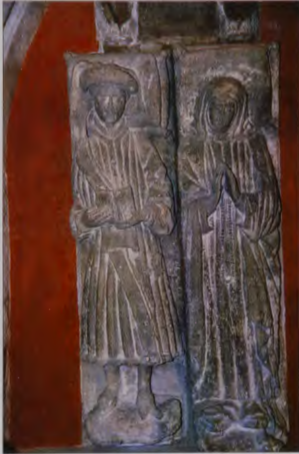
Antiguos sepulcros en el presbiterio de la Iglesia de Santiago y Santa Águeda.