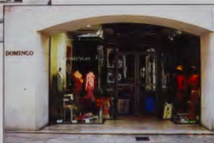
Almirante Bonifaz, 6 Telf. y Fax: 947 20 16 61