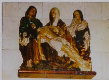
Detalles escultóricos en la Iglesia de Santa Águeda

Virgen siciliana nacida en Catania, al pie del Etna. El prefecto romano Quintiano, al no poder someterla a sus deseos y persuadirla para que ofreciera sacrificios a los dioses, la hizo conducir a un prostíbulo administrado por la cortesana Afrodisia, para que la sometiera a una violación ritual, pero conservó la virginidad milagrosamente. Después, en prisión, el pre-