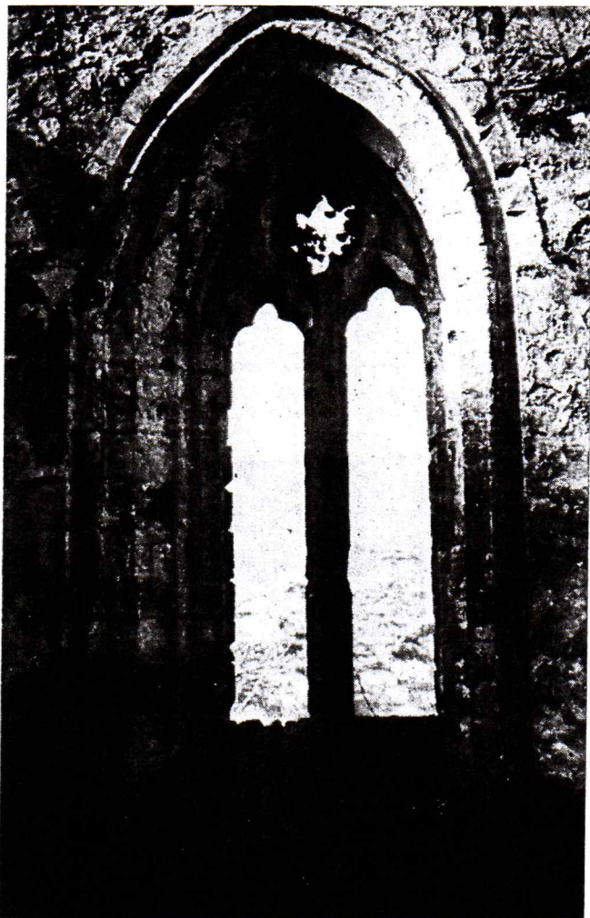
Ventanal Gótico en la Iglesia de Santiago de Villafranca del Bierzo

Es una realidad, ya constatada, la universalidad del Camino. Y nos alegramos de ella. Mejor, la sentimos como cosa nuestra. Como algo, por lo que hemos luchado