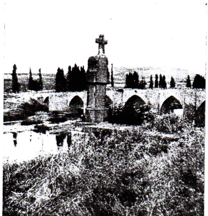
Puente de Santo Domingo de la Calzada.