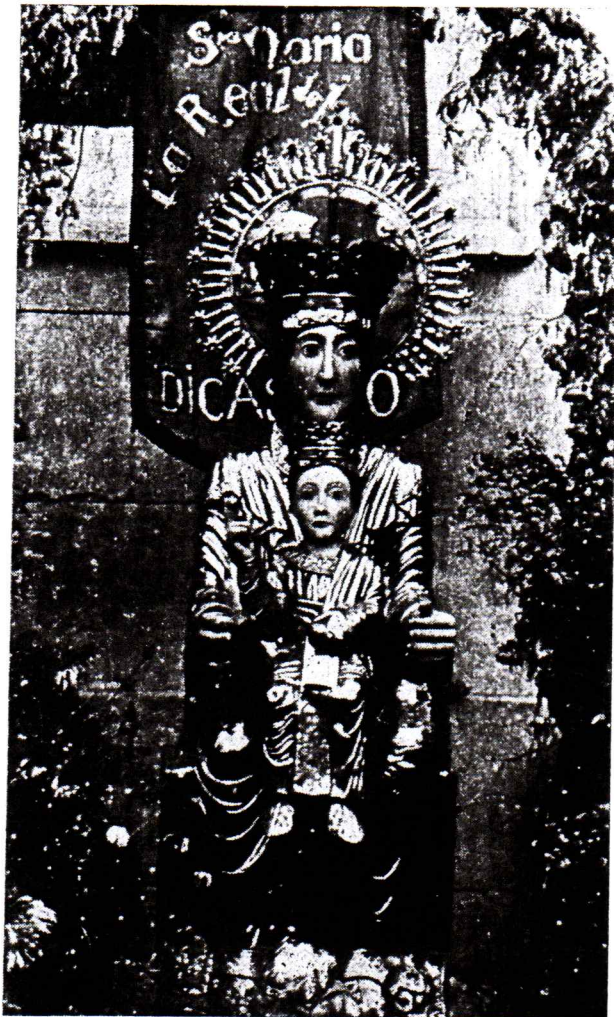
Imagen de Nuestra Señora la Real de Irache

La más hermosa y preciada joya que atesora la iglesia monacal del cenobio iraquense es, sin duda alguna, la imagen de la Virgen María tallada en madera y recubierta toda ella de una chapa de plata.