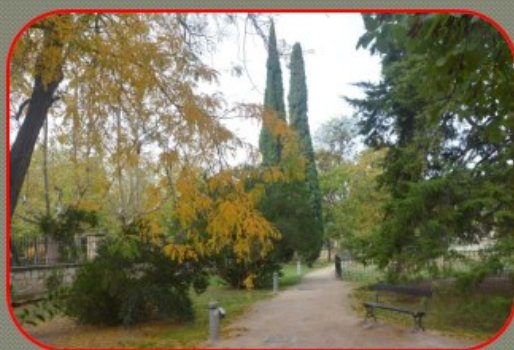
Parque J. Antonio Labordeta