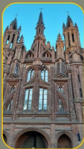
Iglesia de Santa Ana. Vilnius, Lituania