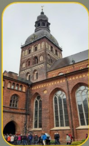
Catedral de Riga. Letonia