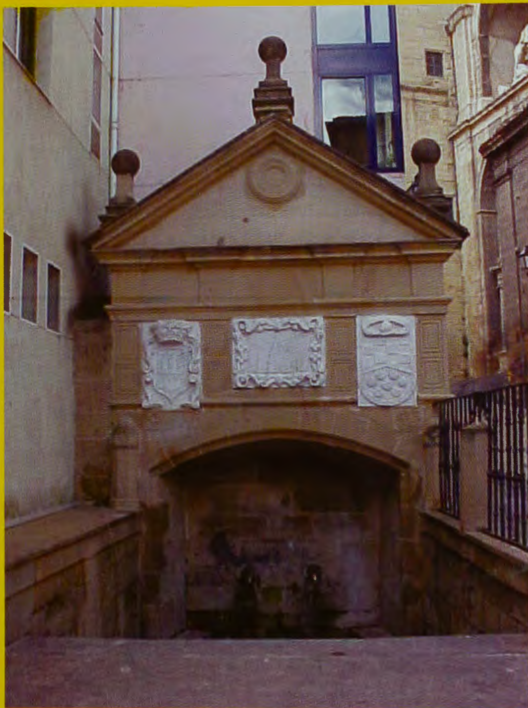
FUENTE DEL PEREGRINO