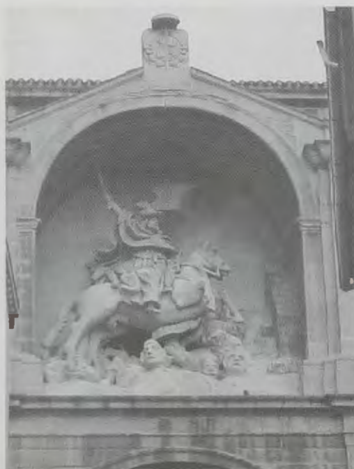
Guía de Logroño

La iglesia de Santiago el Real tuvo una gran importancia para la ciudad de Logroño: al repique de sus campanas, se abrían y cerraban las puertas de la muralla; al toque de arrebato, las gentes acudían a la calle Ollerías, donde los ollereros debían tener grandes ollas y calderos siempre llenos de agua para apagar los incendios.