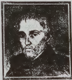
TOMÁS LUIS DE VICTORIA