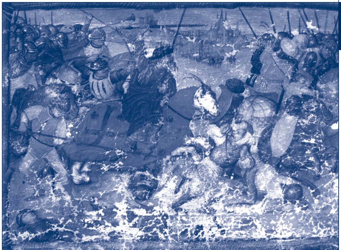
6. Saint Jacques matamore (scène marginale).

La superposition de deux niveaux estompe les limites spatio-temporelles qui auraient dû les dissocier. Elle donne naissance à de nouvelles équations : dans le chef des membres de la confrérie, la chapelle tournaisienne se substitue au sanctuaire de Compostelle pour devenir l'église mère, tout comme les miracles de saint Jacques, épisodes légendaires, sont le reflet d'une réalité vécue. De même que la chapelle figurée dans la miniature peut être considérée comme un signe de l'église de pèlerinage galicienne et la statue de saint Jacques comme une manifestation de sa présence effective, le Cartulaire et son frontispice ont valeur de signe. Ils constituent en soi des reliques, qui attestent la