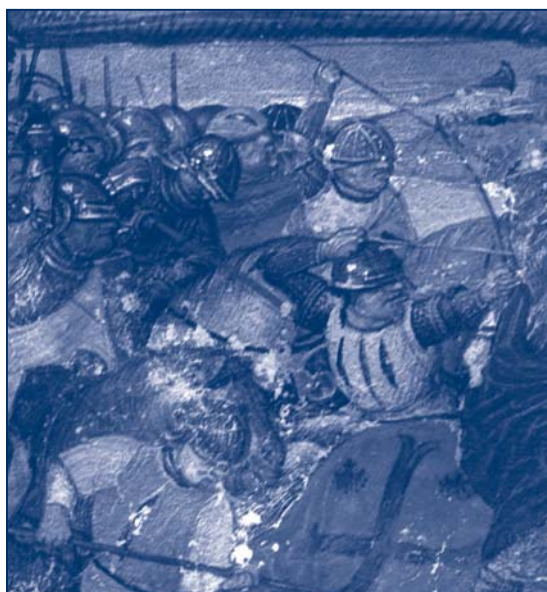
7. Détail de la scène de saint Jacques matamore.

G. WYMANS, « Le déclin de Tournai au XV e siècle », Anciens pays et assemblées d'États , 22 (1961) : 113-134.